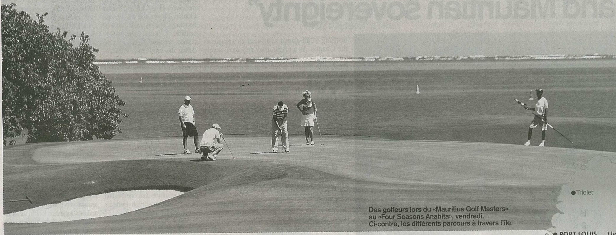
Des golfeurs lors du «Mauritius Golf Masters» au «Four Seasons Anahita», vendredi. Ci-contre, les différents parcours à travers l'île.

LA petite balle blanche est en vedette, les tournois de standing international se succèdent. Après le Mauritius Golf Masters , qui a pris fin samedi sur le parcours d'Anahita, Bel-Ombre, place au MCB Open qui démarre aujourd'hui, à l'hôtel Constance Belle-Mare Plage . Ces événements apportent une visibilité supplémentaire pour Maurice en tant que destination golfique.